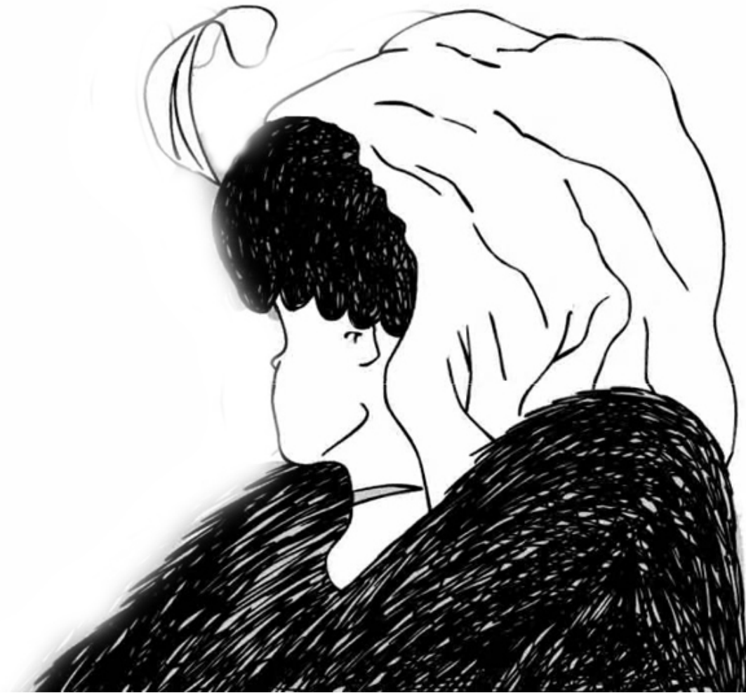
Fig. 2 ¿Qué ves?